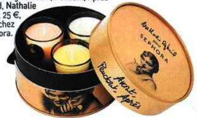
Coffret 3 bougies Avant, Pendant, Après Belle & Bad, Nathalie Rykiel, 25 €, en exclu chez Sephora.