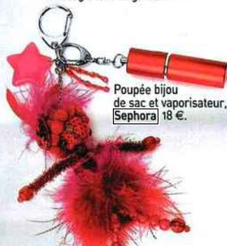
Poupée bijou de sac et vaporisateur, Sephora 18 €.