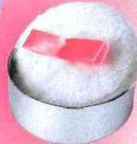
Houppette pailletée Beauty Monop, 7,95 €.