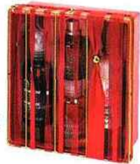
Coffret Grand Soir Cassis Rose, The Body Shop, 40 €.