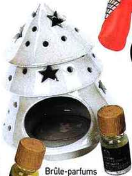
Brûle-parfums Arbre de Noël, 13,50 €; huile parfum d'ambiance Pudding à la Prune ou Coin du Feu, 5,50 € pièce; The Body Shop.

Idee de dernière minute ou simple envie de te faire plaisir, voici une petite sélection-cadeaux pour les Fêtes! Grandiose!