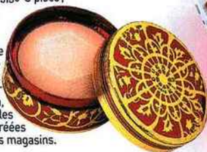
Poudre compacte Précieuse aux éclats de saphir blanc, Guerlain, 60 €, dans les parfumeries agréées et les grands magasins.