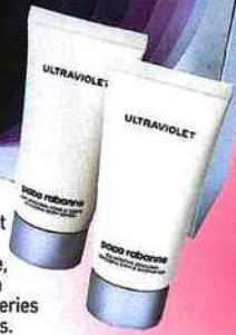
Coffret Ultraviolet Paco Rabanne, 53 €, en parfumeries agrées.