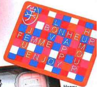
Happy Graphic Box, Castelbajac Parfums, 53 €, dans les parfumeries agrées.