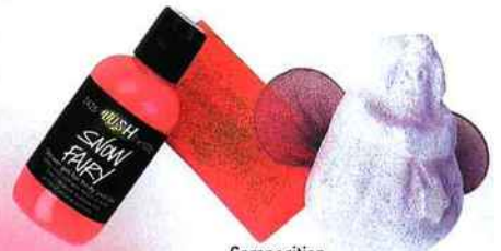
Composition Reine des Neiges, Lush, 17,50 € (www.lush.com).