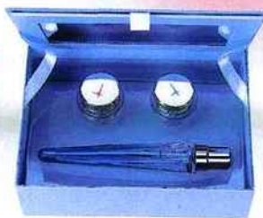
Coffret Noël 2006 Parfum Roll-On & Touches Scintillantes Innocent, Thierry Mugler, 49 €, dans les parfumeries agréées.