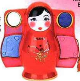
Make-up kit Puposka, Pupa, 14 € la petite, dans les grands magasins et les parfumeries agrées.