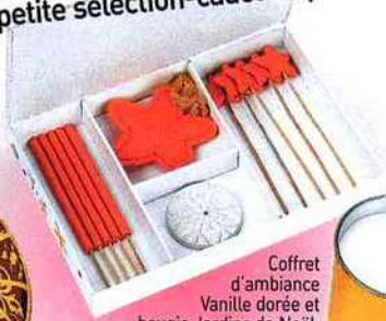
Coffret d'ambiance Vanille dorée et bougie Jardins de Noël, Yves Rocher, 9,90 € et 8,50 €.