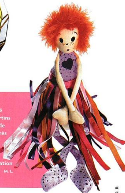
PAR MARION LOUIS.

Elle s'appelle Sylvie, a été dessinée par la Saint Martins School, la célèbre école de mode londonienne, est très rigolote et... très généreuse, puisque les bénéfices des ventes seront reversés à l'association Autistes sans frontières. M. L. 8 €, chez Sephora.